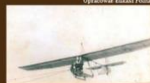
Opracował: Łukasz Politański