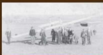
Liga Obrony Powietrznej i Przeciwgazowej (LOPP)